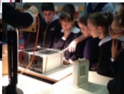
La classe quinta