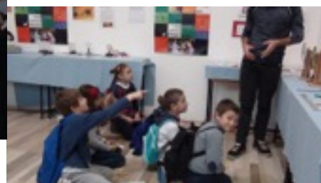
La classe terza