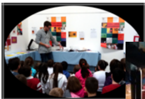
Le classi quarte

Dopo la visita siamo tornati a scuola con la soddisfazione di aver passato due ore da scienziati e...con la presunzione di essere dei piccoli Eistein !!!!