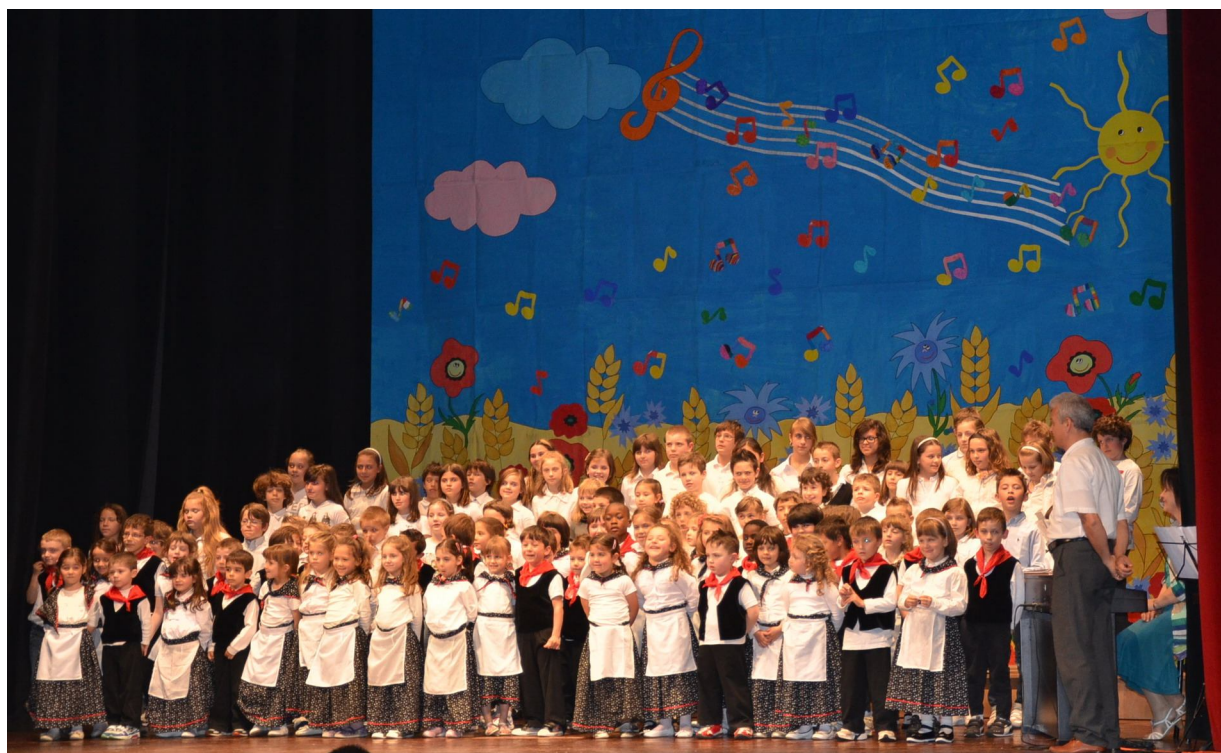
Coro Scolastico di Voci Bianche "Antony David Liberale"